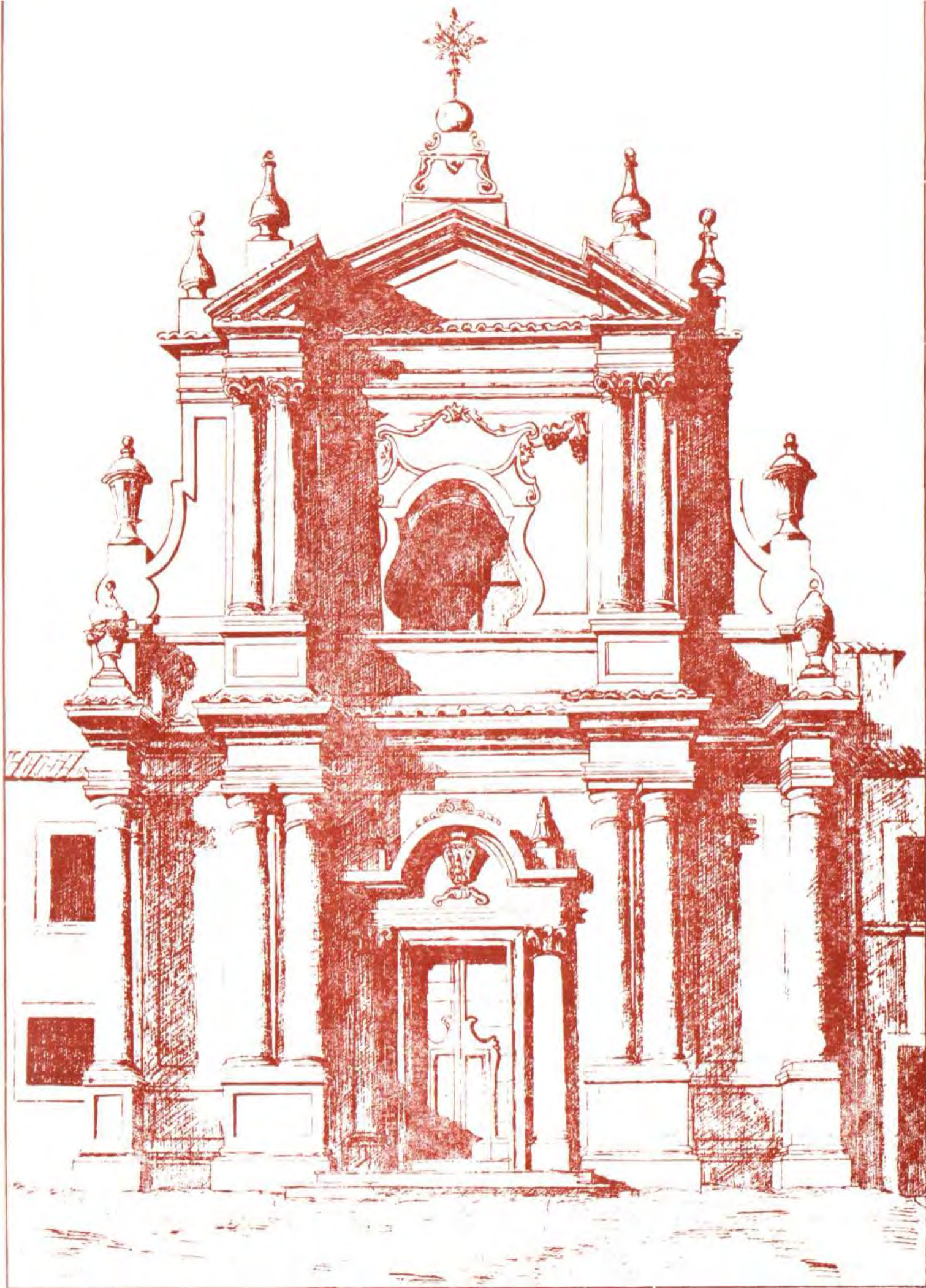
Chiesa Madonna del Carmine - Penne